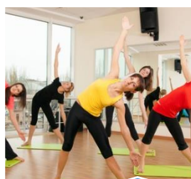
GYMNASTIQUE Tous les lundis