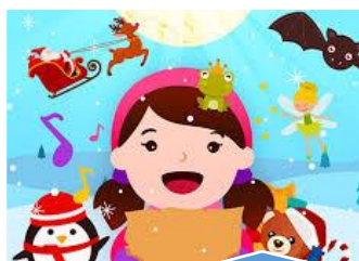
SPECTACLE DE NOEL Vendredi 6 décembre