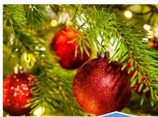
ARBRE DE NOEL Samedi 7 décembre

Venez partager vos idées et participer aux activités !