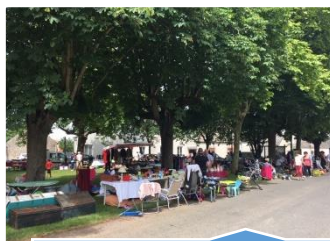
VIDE-GRENIERS Dimanche 23 juin