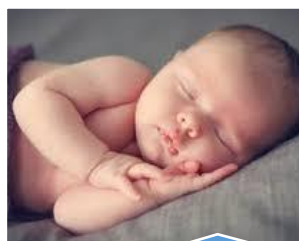
FETE DES MERES Samedi 25 mai