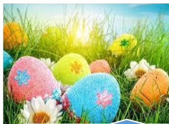
CHASSE A L'OEUF Samedi 20 avril