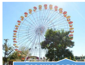
FAMILY PARK St Martin le Beau (37) Dimanche 5 mai