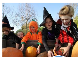
HALLOWEEN Samedi 26 octobre