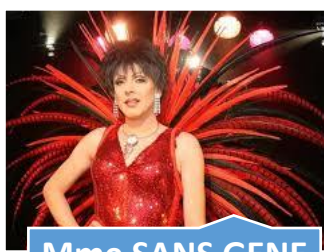
Mme SANS GENE Vendôme (41) Samedi 2 février